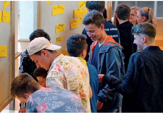
Jugendforum in Baltmannsweiler