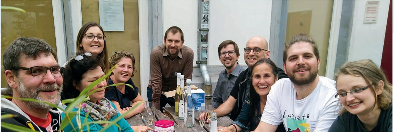
Das Konzeptionsteam stößt auf den erfolgreichen Fachtag an