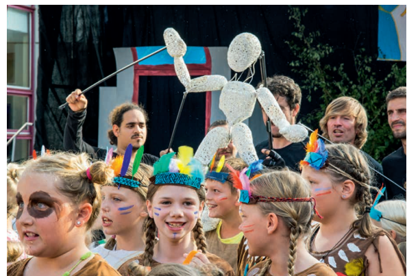
Motto 2019: 30 Jahre Theater