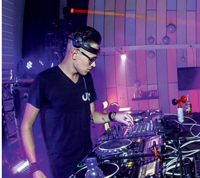
Kultur macht Laune beim Bandcontest „Durch die Decke“ und beim DJ-Workshop in der Linde in Kirchheim