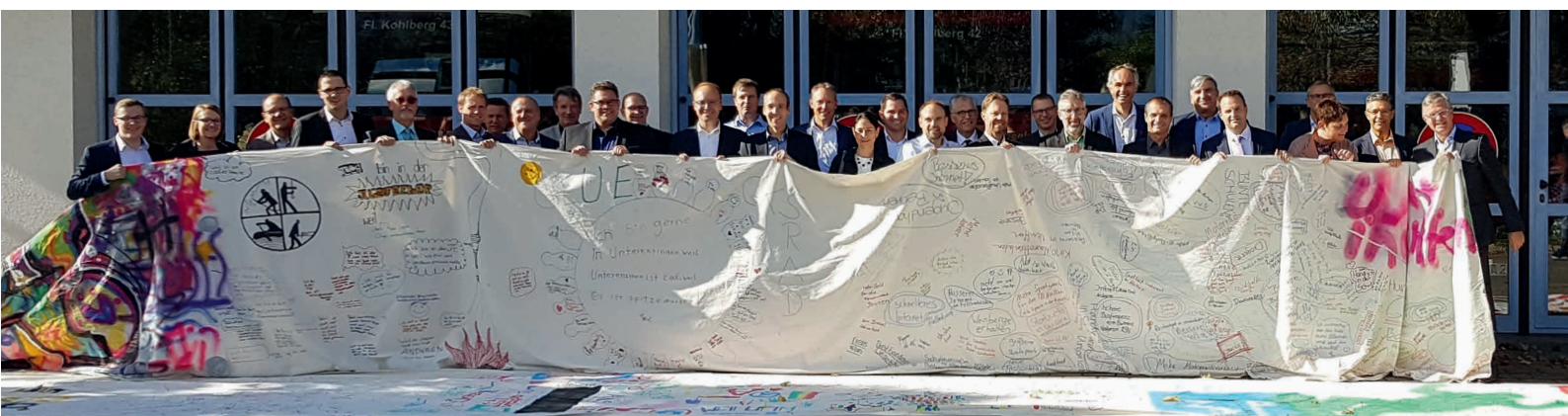
Rolle der Jugend bei der Bürgermeisterversammlung im Oktober 2019