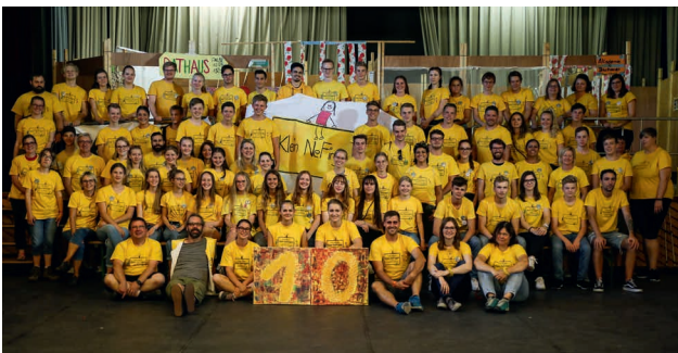
Das Team der Kinderspielstadt KleinNeFingen feiert zehnten Geburtstag

„Gebt den Kindern das Kommando“ ist das Motto in KleinNeFingen. Das funktioniert ausschließlich wegen den vielen freiwillig Engagierten, die ihre Zeit, ihre Ideen und ihre Spielfreude einbringen, und weil unsere Bürger jedes Jahr aufs Neue riesige Lust haben, dabei zu sein.