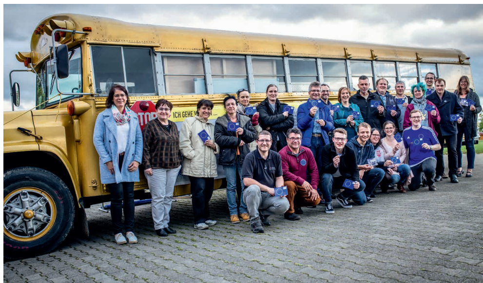
Der MACH DICH-Aktionsbus bei der Mitgliederversammlung am 9. Mai 2019 – dem Europatag