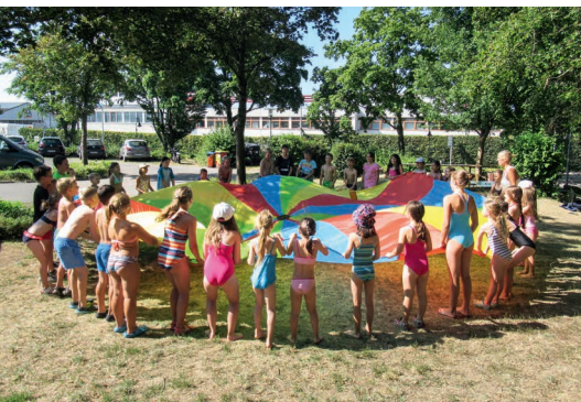
Kinderprogramm in Wolfschlugen