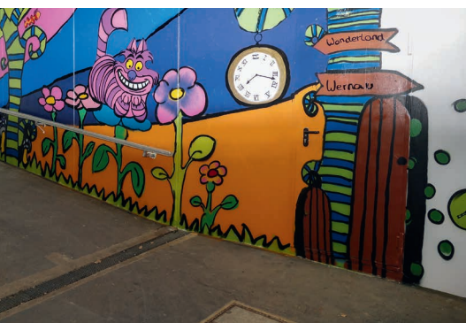
Graffiti-Workshop in Wernau